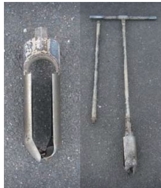
写真-1 ポストホールオーガー

ポストホールオーガー（写真-1）は、軟らかい～中位の硬さの細粒土および粘着性を有する砂質土に用い、スクリューオーガー（写真-2）は、これらの土のほか小礫混じりの土や比較的硬い土に用いる。また、軟らかい粘性土は、ポストホール型に比べ乱れの少ないサンプルを採取できる。