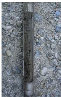
写真-3 土取器 (市販品)

スウェーデン式サウンディング試験を実施した試験孔に器具を挿入して、目標深度から試料を採取する。ハンドオーガーボーリングに比べて、径が小さいため、比較的簡単に採取できる。器具は市販されているもの（写真-3）や市販されているスクリューオーガーを加工してスウェーデン式サウンディング試験のロッドにジョイントできるようにしたもの（写真-4）など多様である。注意深く実施しないと、目標深度以外の土が混入するおそれがある。