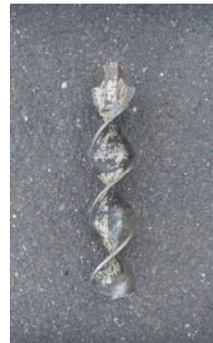
写真-2 スクリューオーガー