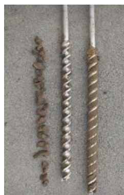
写真-4 スクリュータイプ