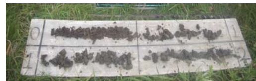
採取した試料の例 (2)