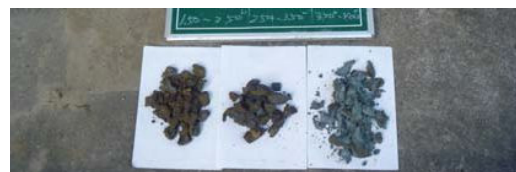
採取した試料の例 (1)