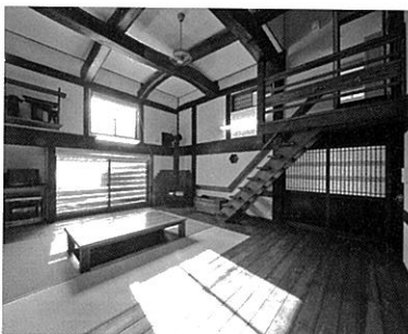
リフォームを超える改修事例 →21ページ