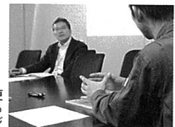
素人にとって急な設計変更などはすごくパワーが要る →40ページ