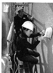
築10年目のO邸の屋根や外壁は？ →79ページ