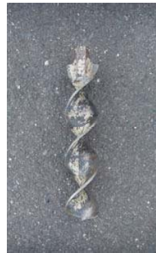
写真-2 スクリューオーガー