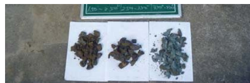
採取した試料の例 (1)