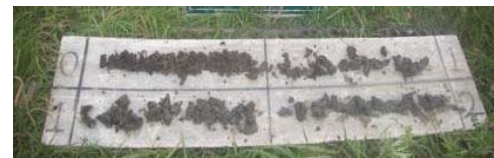
採取した試料の例 (2)