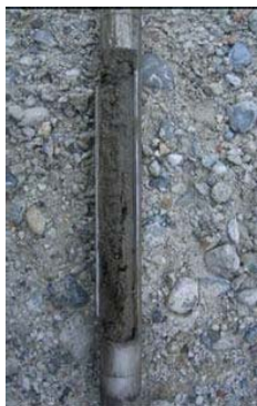
写真-3 土取器（市販品）

スウェーデン式サウンディング試験を実施した試験孔に器具を挿入して、目標深度から試料を採取する。ハンドオーガーボーリングに比べて、径が小さいため、比較的簡単に採取できる。器具は市販されているもの（写真-3）や市販されているスクリューオーガーを加工してスウェーデン式サウンディング試験のロッドにジョイントできるようにしたもの（写真-4）など多様である。注意深く実施しないと、目標深度以外の土が混入するおそれがある。