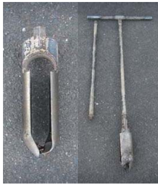
写真-1 ポストホールオーガー

ポストホールオーガー（写真-1）は、軟らかい～中位の硬さの細粒土および粘着性を有する砂質土に用い、スクリューオーガー（写真-2）は、これらの土のほか小礫混じりの土や比較的硬い土に用いる。また、軟らかい粘性土は、ポストホール型に比べ乱れの少ないサンプルを採取できる。